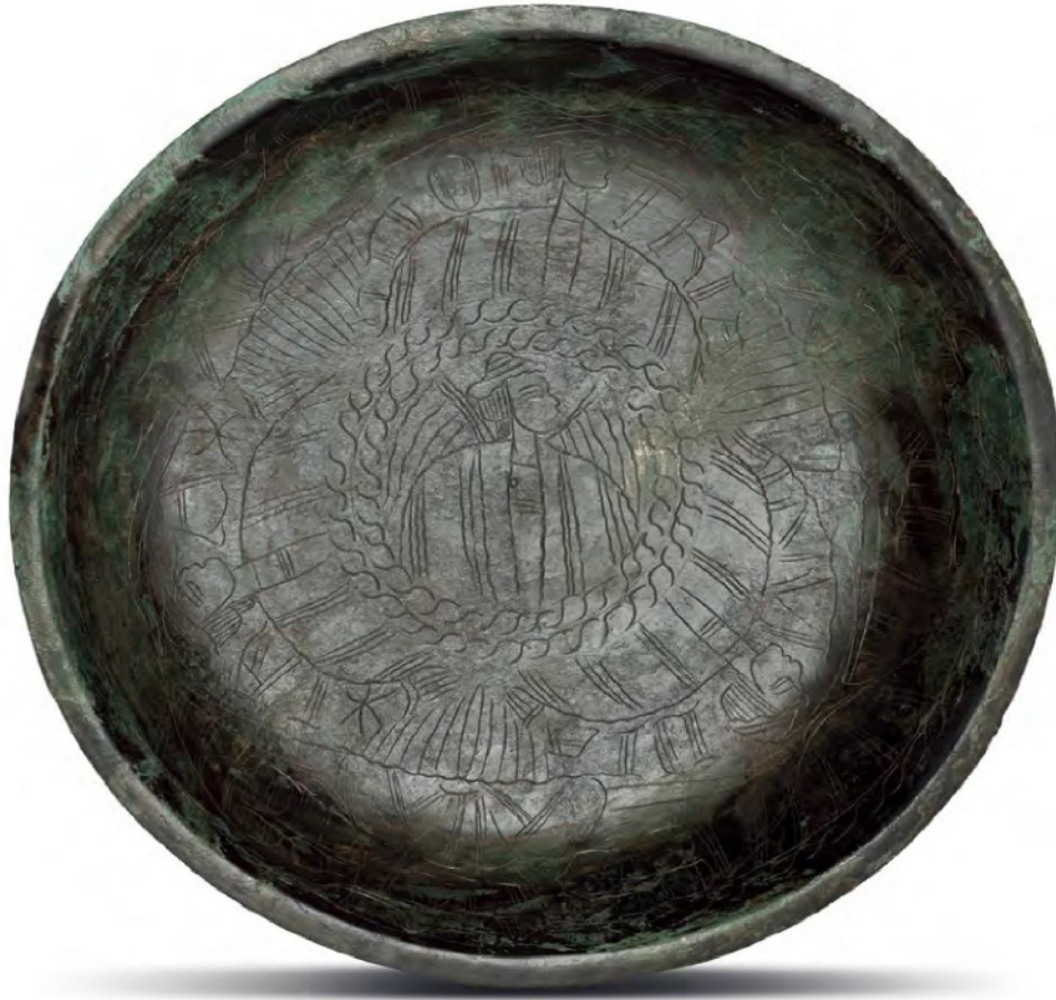
Duitsland, mogelijk Saksen. Bronslegering, roodkoper en zink. Diameter 26 cm, hoogte circa 5 cm.